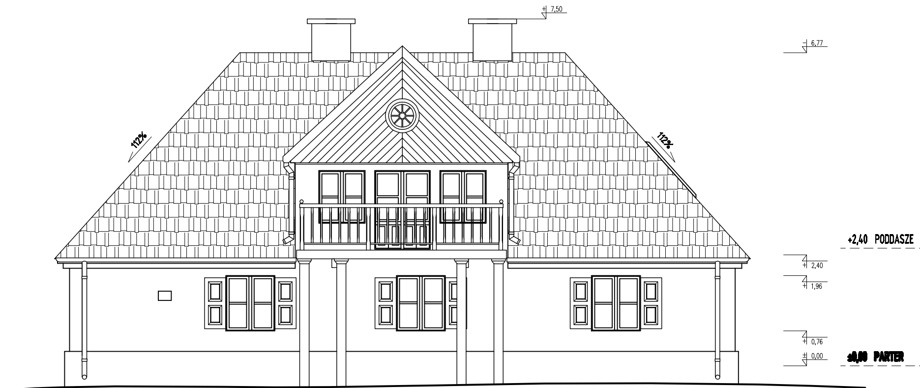
ELEWACJA PÓŁNOCNO- WSCHDNIA