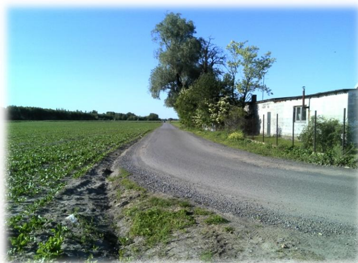
Foto.24/9 DG styk z Gminą Baranów m. Nowe Kłudno – w kierunku północnym