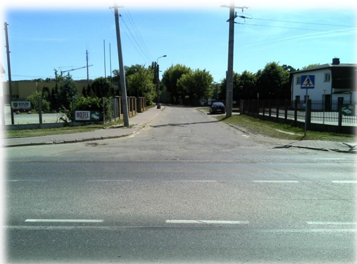
Foto.99/63 DW 579 ul. Matejki skrzyżowanie z ul. Żydowską – w kierunku zachodnim