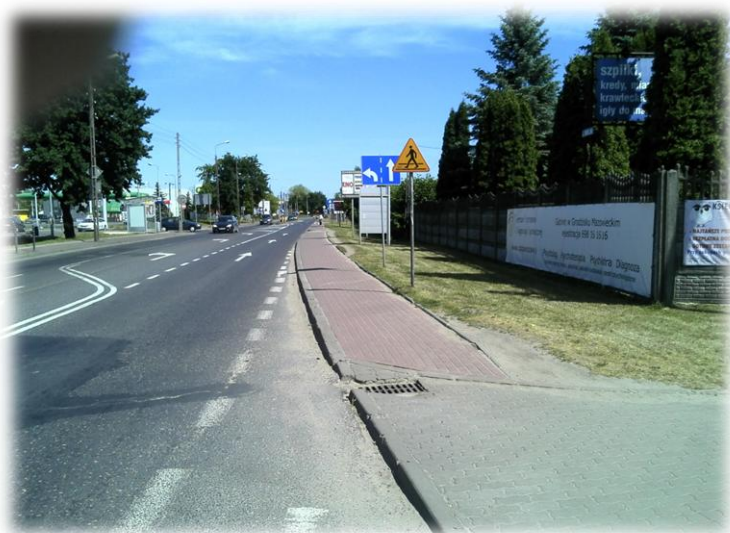
Foto.94/57 DW 579 ul. Matejki po stronie zachodniej – w kierunku południowym