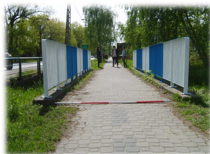
Foto.6/78 ul. Królewska (DW 719) mostek nad rzeką Rokitnica – w kierunku zachodnim