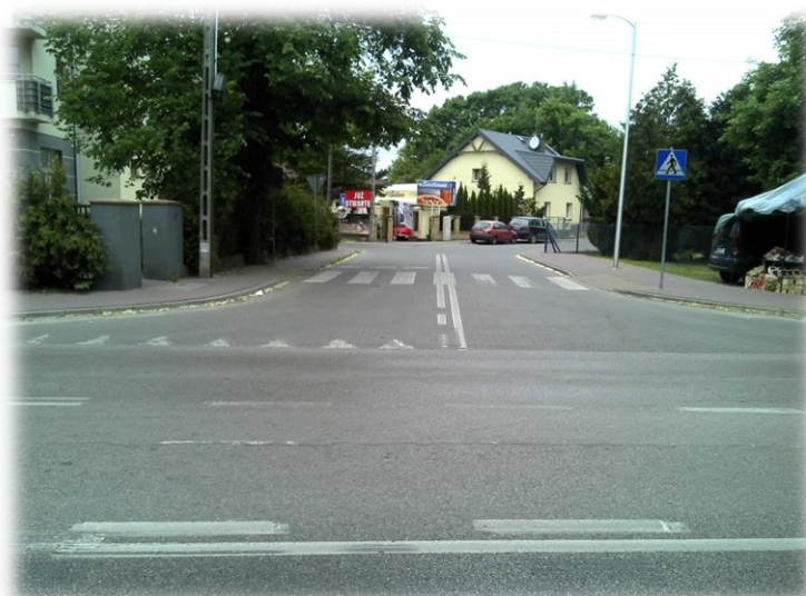
Foto.160/145 DW 579 ul. Żyrardowska skrzyżowanie z ul. Garbarską – w kierunku północnym