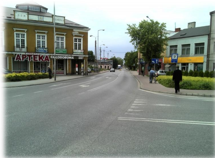
Foto.150/158 DW 579 ul. Sienkiewicza skrzyżowanie z ul. Bałtycką – w kierunku zachodnim