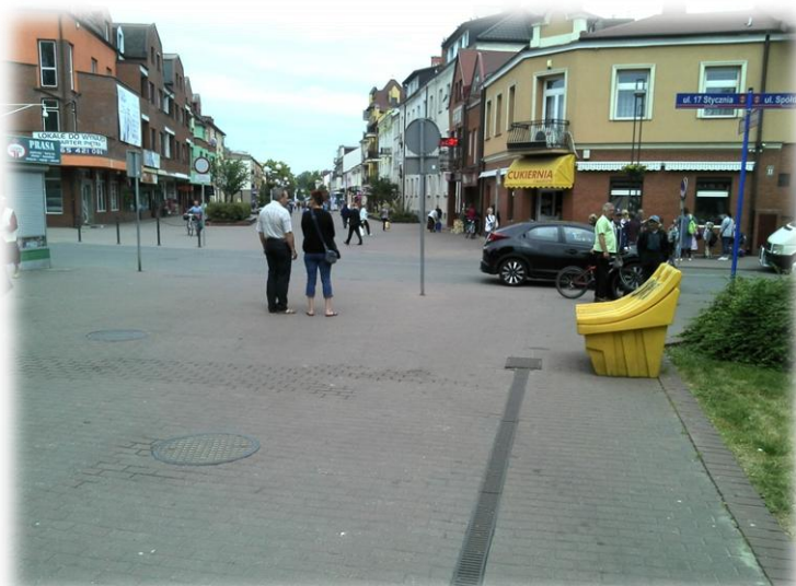
Foto.154/154 Plac Wolności skrzyżowanie z ul. Spółdzielczą – w kierunku północnym