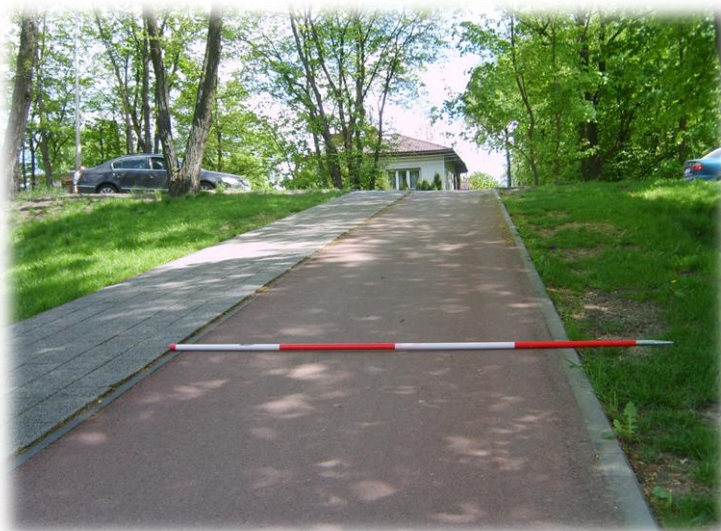
Foto.110/187 Park im. Skarbków do DW 579 Okulickiego – w kierunku wschodnim