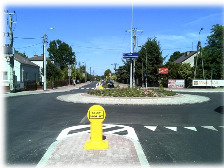
Foto.138/66 ul. 3 Maja (DP 1526) skrzyżowanie z ul. Orzeszkowej – w kierunku wschodnim