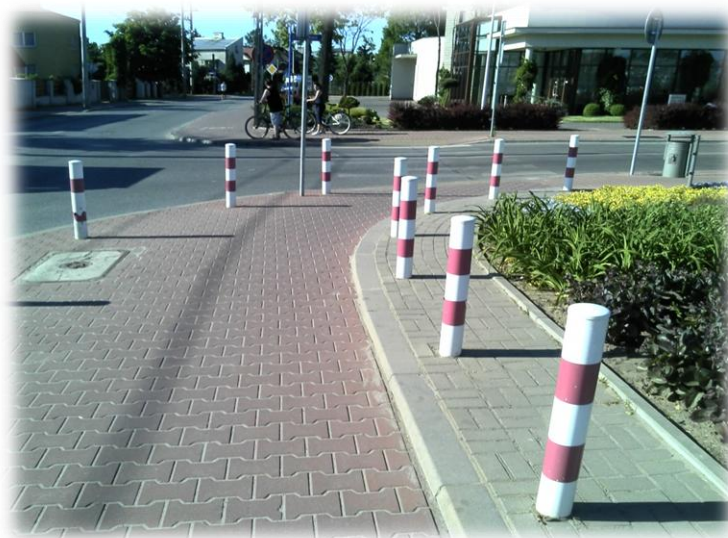
Foto. 48/116 przejście przez ul. Spokojną na skrzyżowaniu z ul. Montwiłła – w kierunku północnym