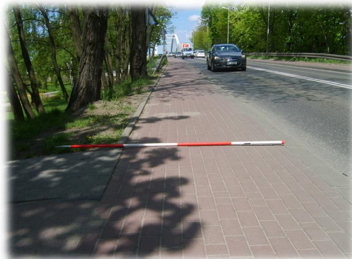
Foto.108/185 DW 579 ul. Okulickiego przed wiaduktem kolejowym – w kierunku północnym