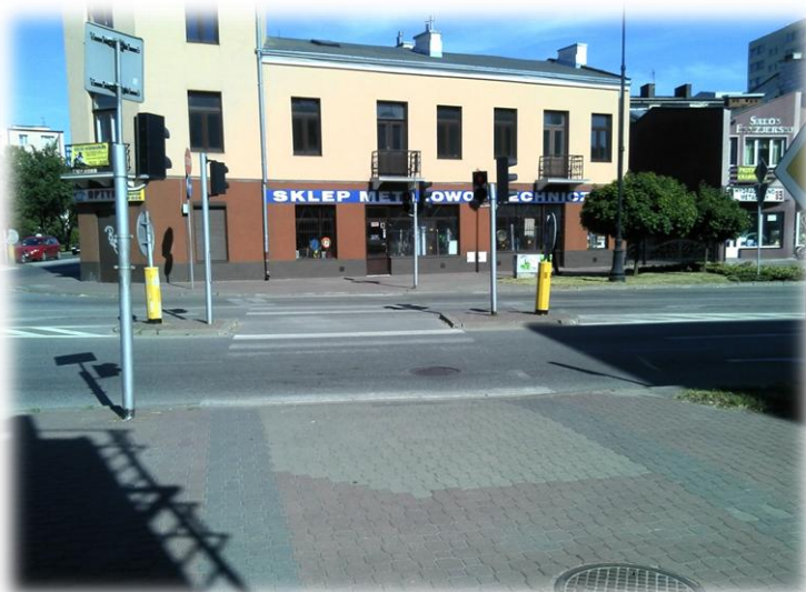
Foto.40/95 Przejście przez ul. Montwiła i ul. Radońską – w kierunku wschodnim