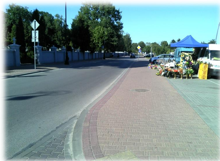
Foto.47/119 ul. Spokojna po stronie południowej – w kierunku wschodnim