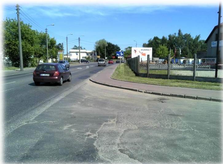
Foto.98/62 DW 579 ul. Matejki skrzyżowanie z ul. Żydowską – w kierunku południowym