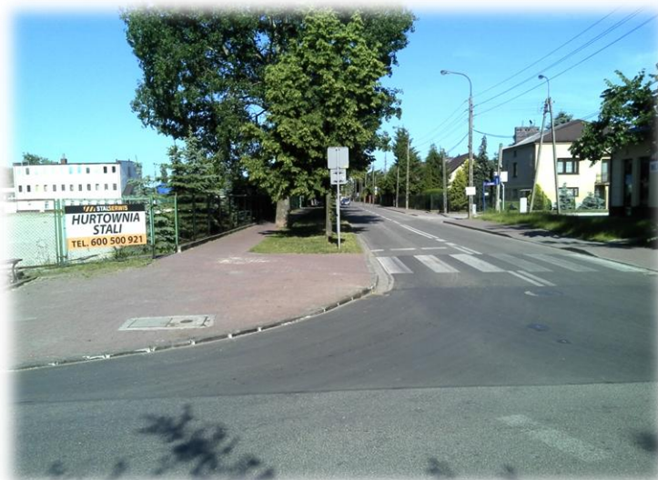
Foto.53/110 ul. Dalekiej skrzyżowanie z ul. Mokronoskich – w kierunku wschodnim