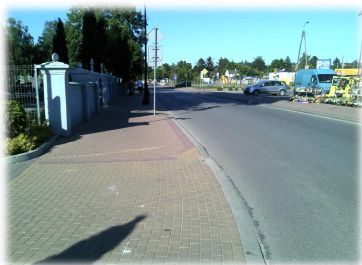
Foto.46/118 ul. Spokojna po stronie północnej – w kierunku wschodnim