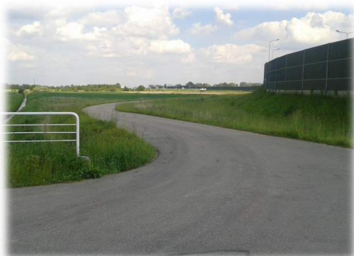
Foto.68/169 Droga(wzdłuż A2 po stronie północnej) – w kierunku wschodnim