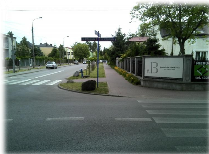
Foto.149/159 ul. 3 Maja skrzyżowanie z ul. Bartniaka – w kierunku zachodnim