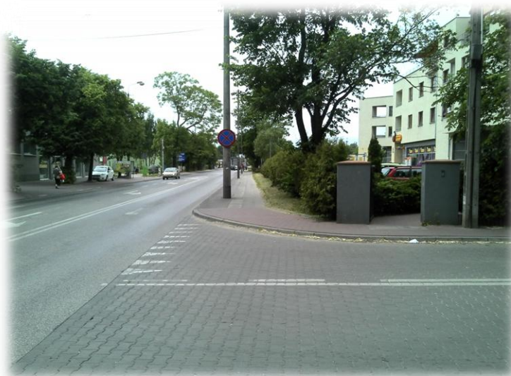
Foto.159/146 DW 579 ul. Żyrardowska skrzyżowanie z ul. Garbarską – w kierunku zachodnim