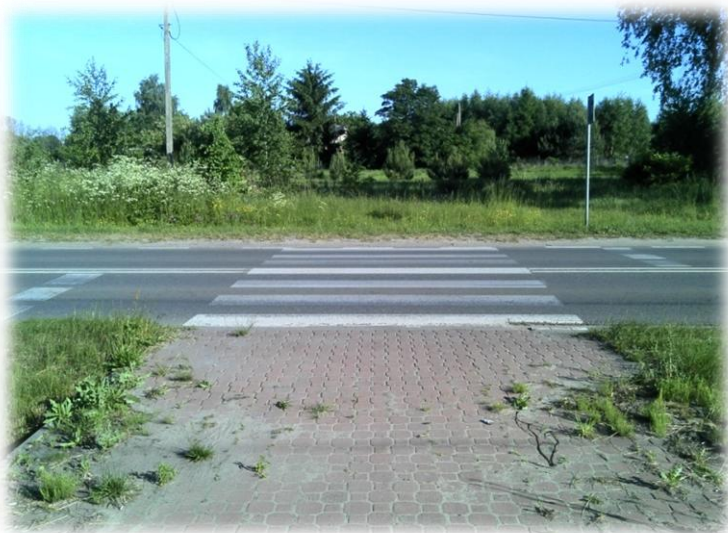
Foto.3/127 ul. Orlicz-Dreszera (DW 719) przejście – w kierunku południowym