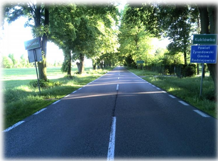
Foto.136/27 DW 579 styk z Gminą Radziejowice – w kierunku południowym