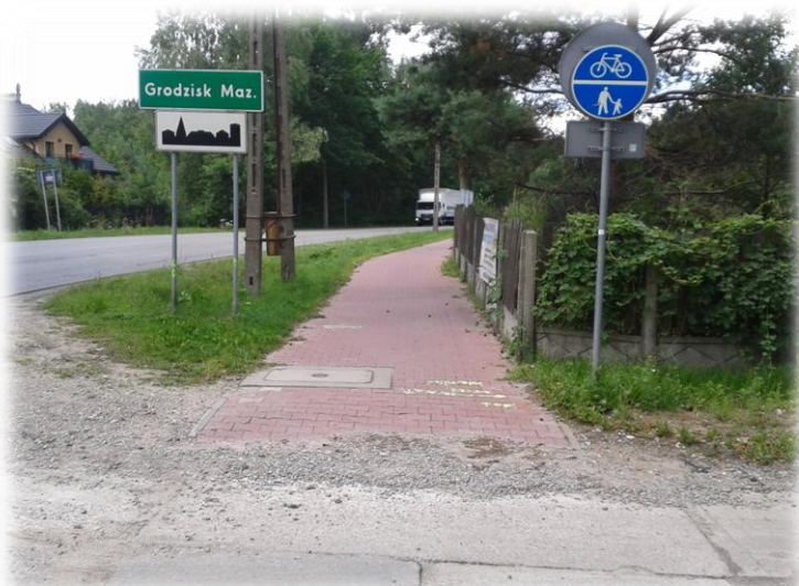
Foto.171/178 ul. Nadarzyńska skrzyżowanie z ul. Okrężną – w kierunku północno-zachodnim