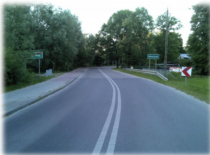
Foto.143/38 ul. 3 Maja (DP 1526) styk z Gminą Milanówek – w kierunku wschodnim