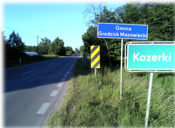
Foto.1/25 ul. Gen. G. Orlicz-Dreszera (DW 719) styk z Gminą Jaktorów – w kierunku wschodnim

Integralną częścią Załącznika nr 1 jest MAPA NR nr 1