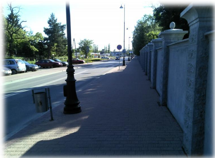
Foto.44/121 ul. Spokojna po stronie północnej – w kierunku zachodnim