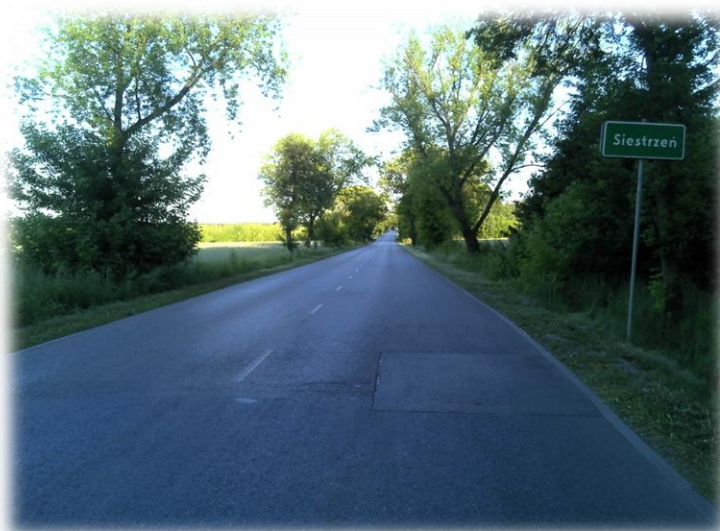
Foto.36/31 DP 1503 styk z Gminą Żabia Wola – w kierunku południowym