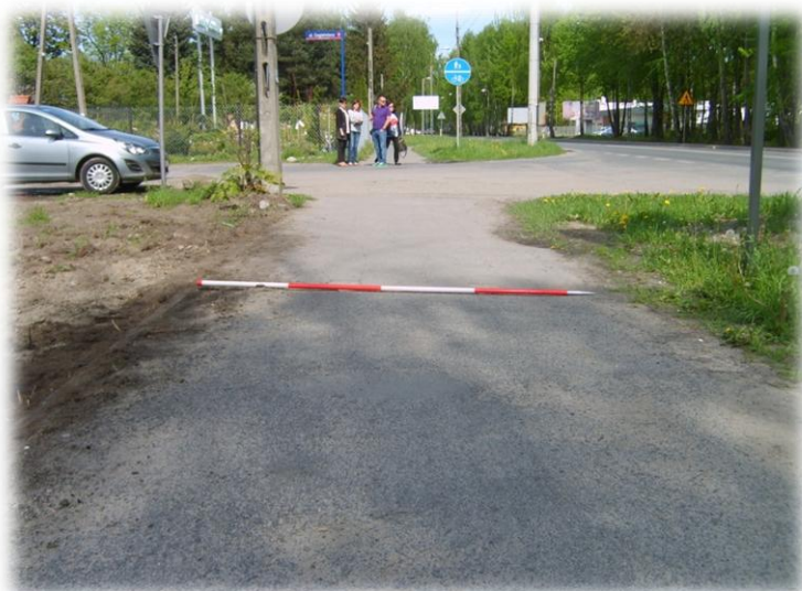
Foto.8/80 ul. Królewska (DW 719) po stronie północnej – w kierunku wschodnim