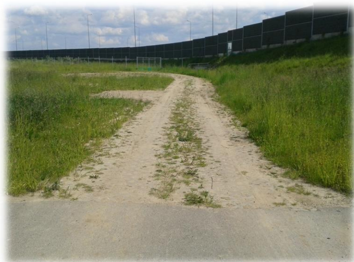
Foto.69/170 Droga (wzdłuż A2 po stronie północnej) – w kierunku wschodnim