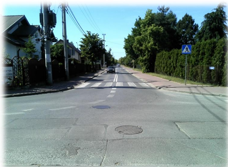
Foto.15/83 ul. Piaskowa skrzyżowanie z ul. Na Laski – w kierunku zachodnim