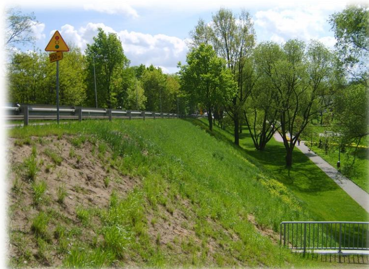
Foto.107/184 DW 579 ul. Okulickiego nasyp za wiaduktem kolejowym – w kierunku południowym