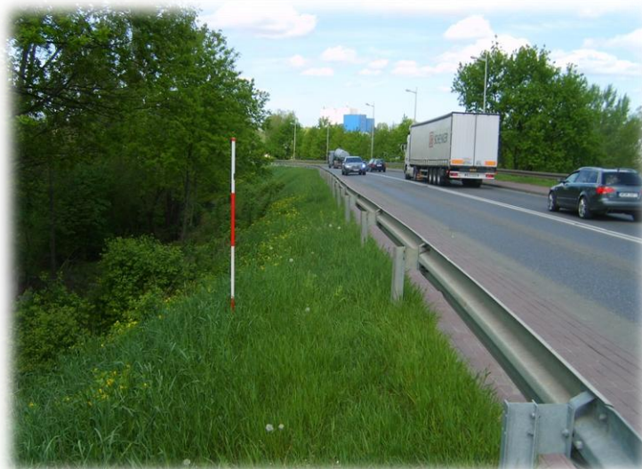
Foto.101/178 DW 579 ul. Matejki nasyp przed wiaduktem kolejowym – w kierunku północnym