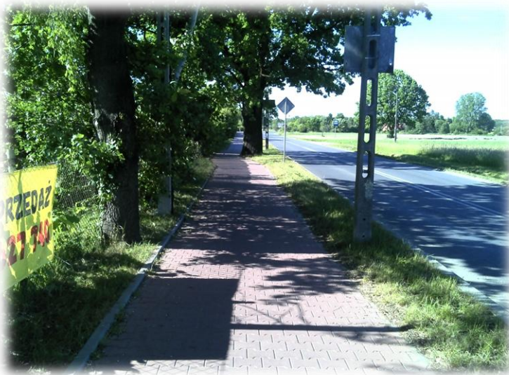
Foto.33/98 DP 1505 ul. Osowiecka po stronie zachodniej – w kierunku północnym