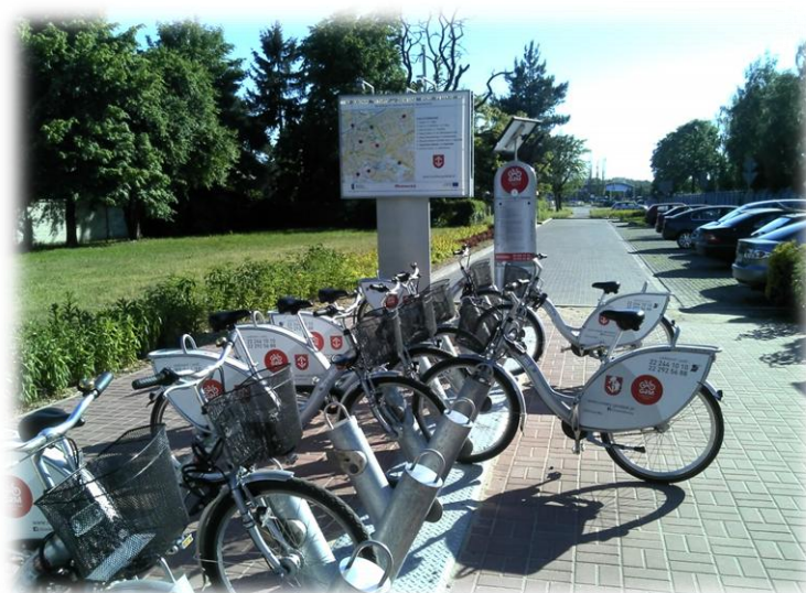
Foto.45/124 ul. Radońska (stacja rowerowa) po stronie południowej – w kierunku zachodnim