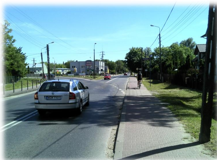
Foto.90/52 Skrzyżowanie DW 579 z ul. Traugutta – w kierunku południowym