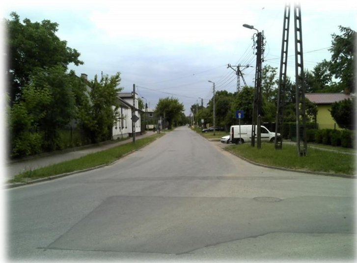
Foto.165/132 ul. Świeża skrzyżowanie z ul. Narutowicza – w kierunku południowym