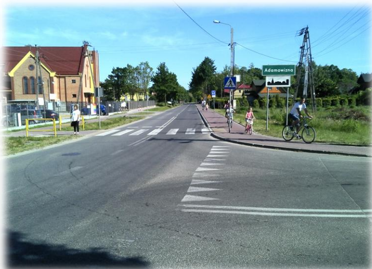
Foto.34/99 DP 1505 ul. Osowiecka po stronie zachodniej – w kierunku południowym