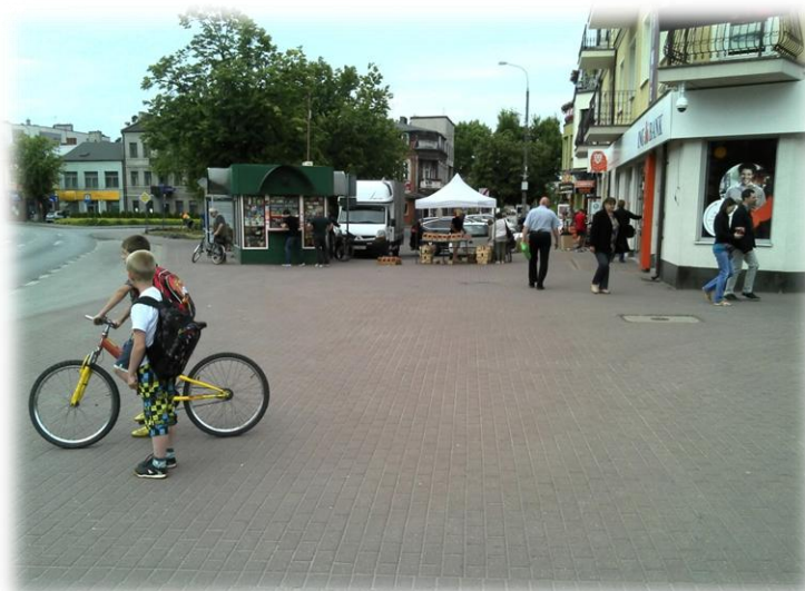
Foto.156/157 DW 579 ul. Sienkiewicza (na wysokości Placu Wolności) – w kierunku zachodnim