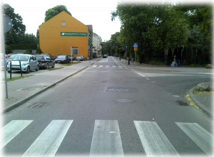
Foto.147/161 ul. Kilińskiego skrzyżowanie z ul. 3 Maja – w kierunku północnym