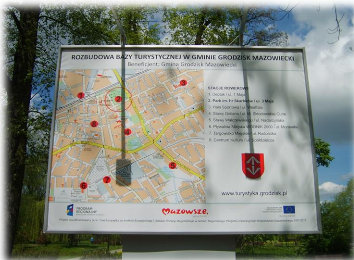
Foto.112/189 Park im. Skarbków (tablica inf. stacji rowerowych) – w kierunku zachodnim