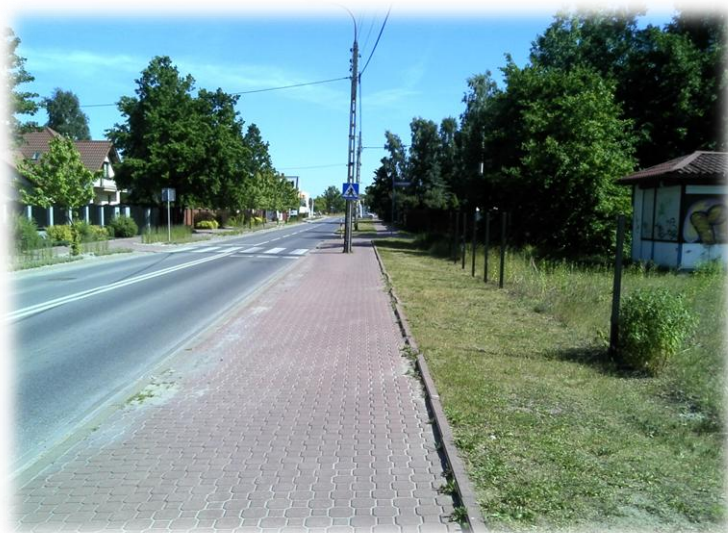
Foto.14/82 ul. Na Laski po stronie zachodniej – w kierunku południowym