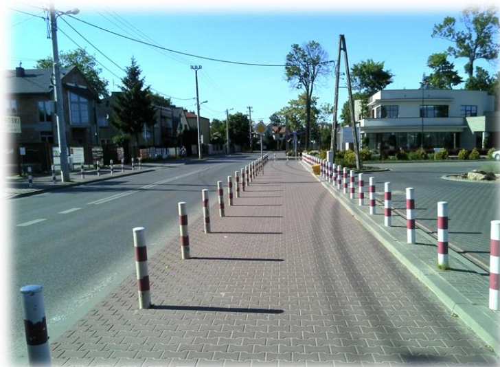
Foto.49/115 ul. Montwiłła po stronie wschodniej – w kierunku północnym