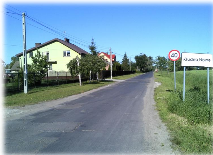
Foto.23/8 DG styk z Gminą Baranów m. Nowe Kłudno – w kierunku wschodnim