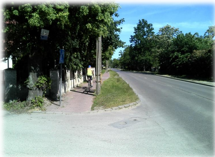
Foto.38/88 ul. Nadarzyńska (DP 1503) po stronie wschodniej – w kierunku południowym