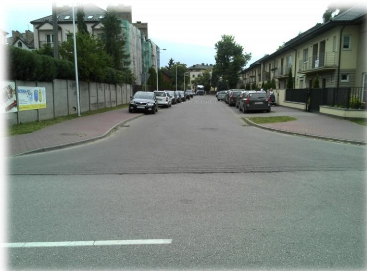
Foto.162/143 ul. Bałtycka skrzyżowanie z ul. Garbarską – w kierunku południowym