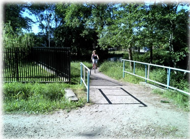
Foto.58/106 kładka nad rzeką Mrowna z ul. Przesmyk – w kierunku północnym