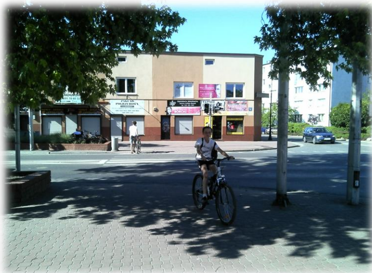
Foto.39/94 ul. Sienkiewicza (DW 719) na wysokości ul. Montwiła – w kierunku północnym