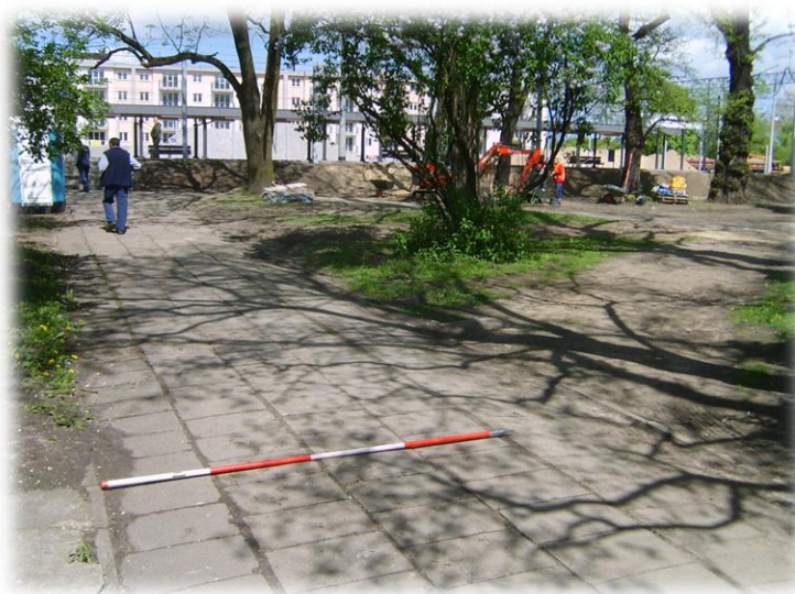
Foto.120/196 ul. 1 Maja (lokalizacja parkingu rowerowego)– w kierunku północnym