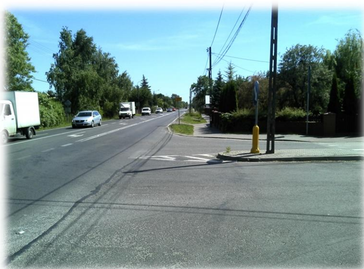
Foto.81/45 DW 579 skrzyżowanie z DP 1509 – w kierunku południowym