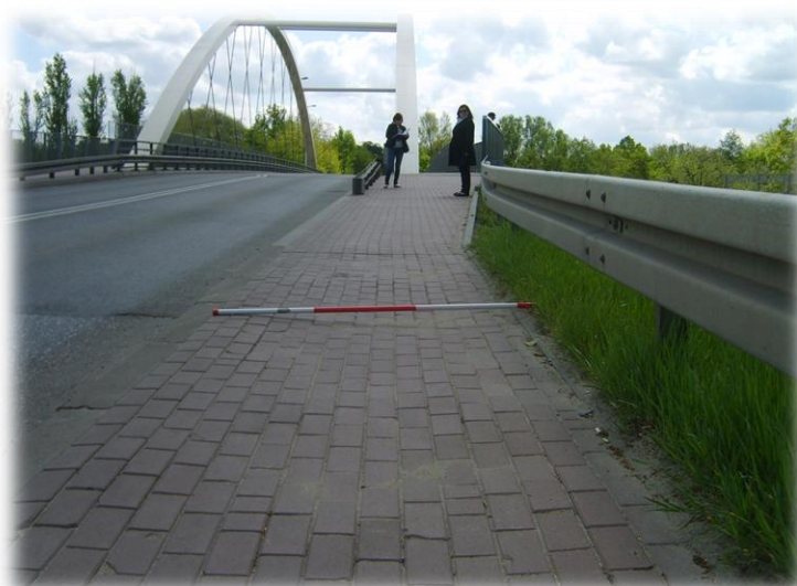
Foto.103/180 DW 579 ul. Matejki przed wiaduktem kolejowym – w kierunku południowym