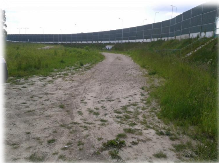
Foto.72/173 Droga (wzdłuż A2 po stronie południowej) – w kierunku zachodnim