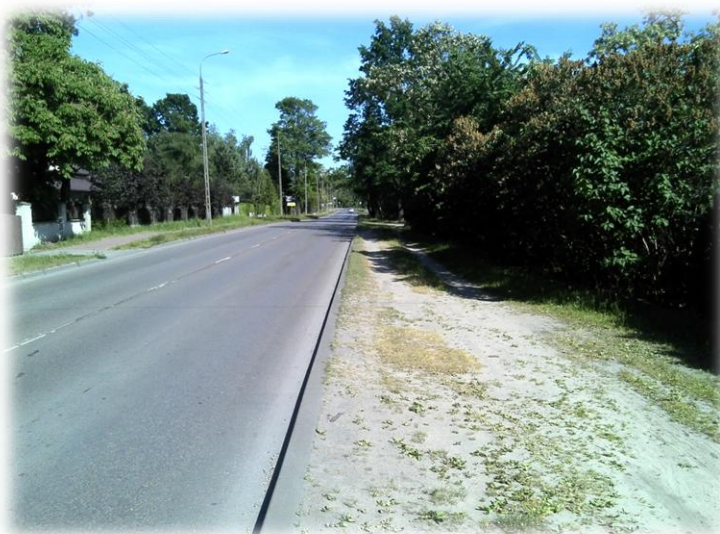
Foto.37/87 ul. Nadarzyńska (DP 1503) po stronie zachodniej – w kierunku południowym