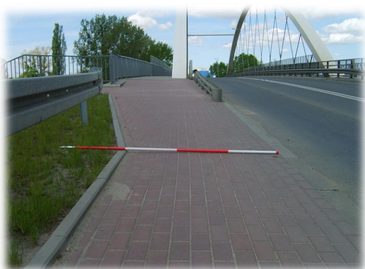
Foto.106/183 DW 579 ul. Okulickiego przed wiaduktem kolejowym – w kierunku północnym