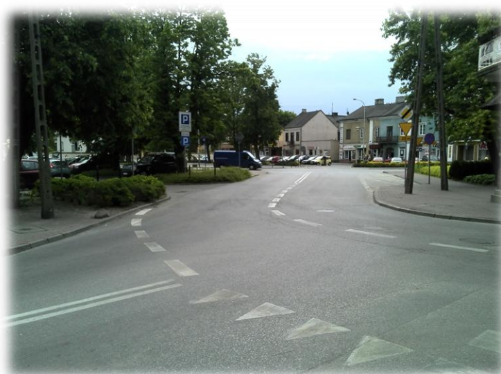
Foto.157/150 ul. Bałtycka skrzyżowanie z ul. Obrońców Getta – w kierunku południowym