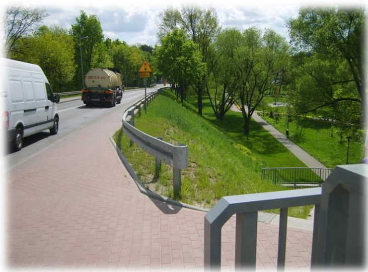
Foto.105/182 DW 579 ul. Okulickiego za wiaduktem kolejowym – w kierunku południowym