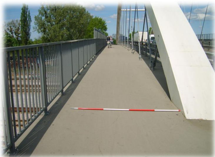
Foto.104/181 DW 579 ul. Okulickiego wiadukt kolejowy – w kierunku północnym