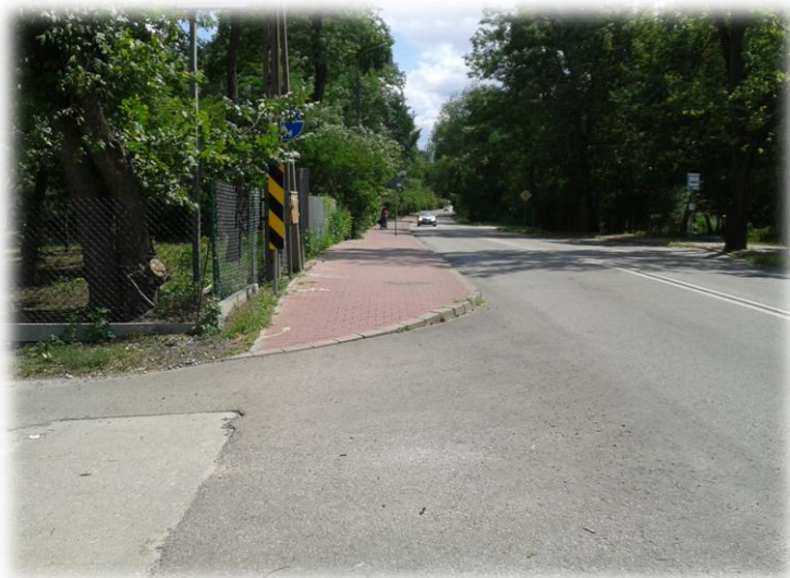
Foto.170/179 ul. Nadarzyńska skrzyżowanie z ul. Wiejską – w kierunku południowo-wschodnim