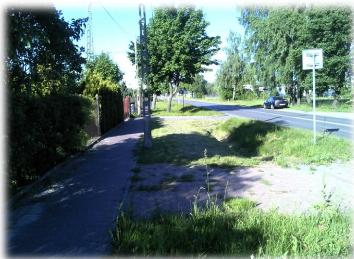
Foto.4/128 ul. Orlicz-Dreszera (DW 719) za skrzyżowaniem z ul. Marsa – w kierunku wschodnim