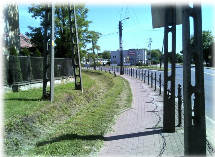
Foto.92/55 DW 579 w kierunku ul. Matejki skrzyżowanie z ul. Traugutta – w kierunku południowym