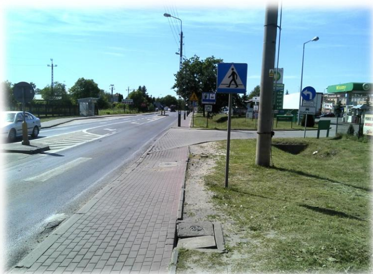
Foto.100/64 DW 579 ul. Matejki na wysokości ul. Żydowskiej – w kierunku północnym