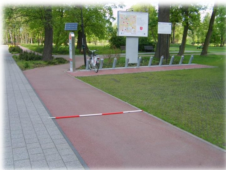
Foto.111/188 Park im. Skarbków (stacja rowerowa) – w kierunku zachodnim