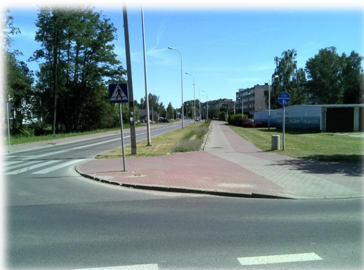
Foto.144/70 ul. 3 Maja (DP 1526) skrzyżowanie z ul. Teligi – w kierunku południowym