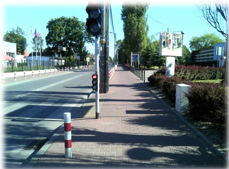
Foto.51/113 ul. Montwiła po stronie zachodniej – w kierunku południowym