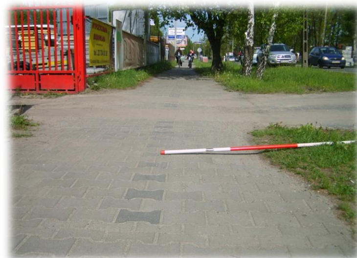
Foto.7/79 ul. Królewska (DW 719) po stronie północnej – w kierunku wschodnim