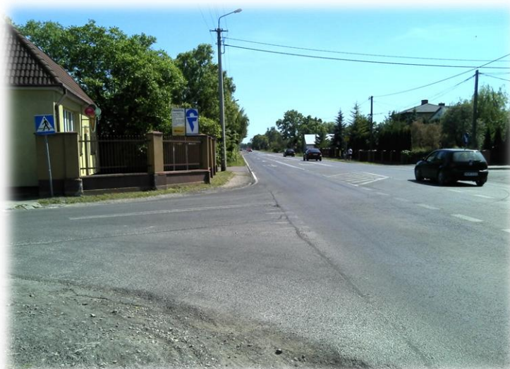
Foto.83/46 DW 579 skrzyżowanie z DP 1509 – w kierunku południowym