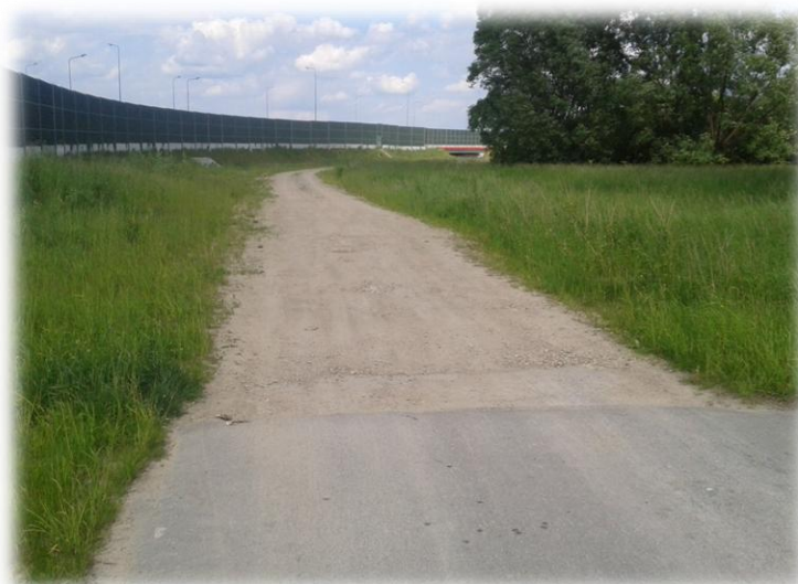
Foto.73/174 Droga (wzdłuż A2 po stronie południowej) – w kierunku wschodnim