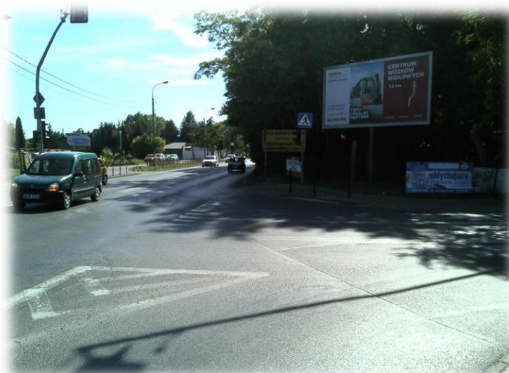
Foto.13/91 ul. Królewska (DW 719) skrzyżowanie z ul. Orzeszkowej – w kierunku zachodnim