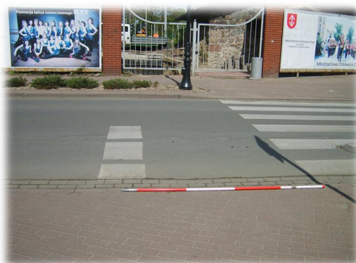
Foto.127/203 ul. 1 Maja przejście w okolicy dworca PKP – w kierunku północnym