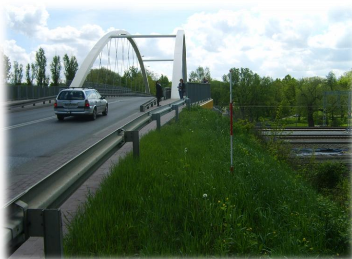
Foto.102/179 DW 579 ul. Matejki nasyp przed wiaduktem kolejowym – w kierunku południowym