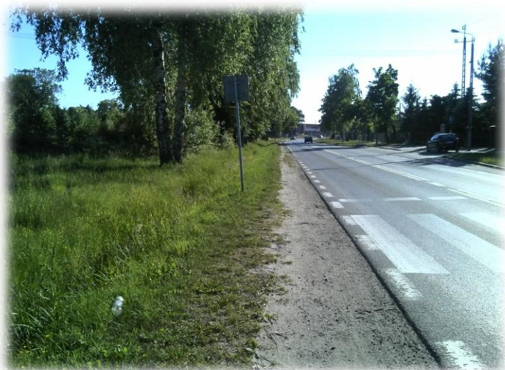
Foto.2/126 ul. Orlicz-Dreszera (DW 719) przed skrzyżowaniem z ul. Marsa – w kierunku zachodnim