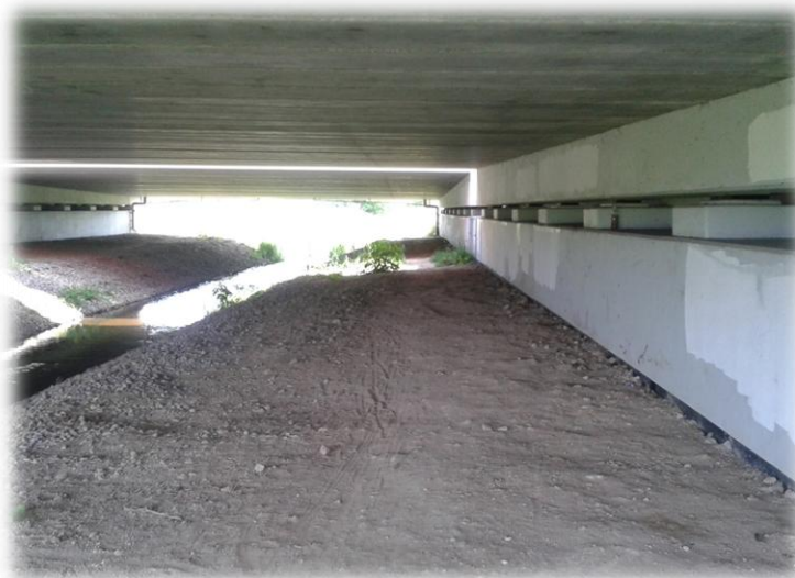
Foto.71/172 Przejście pod A2 (rzeka Rokitnica) – w kierunku południowym