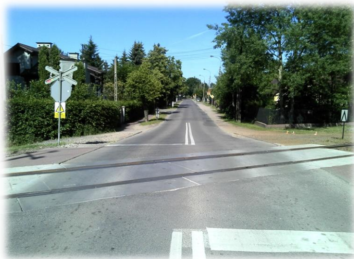
Foto.16/85 ul. Piaskowa przejazd przez tory WKD – w kierunku wschodnim