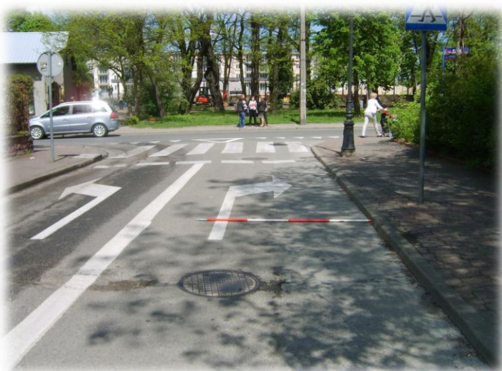
Foto.117/194 ul. Kilińskiego do skrzyżowania z ul. 1 Maja – w kierunku północnym