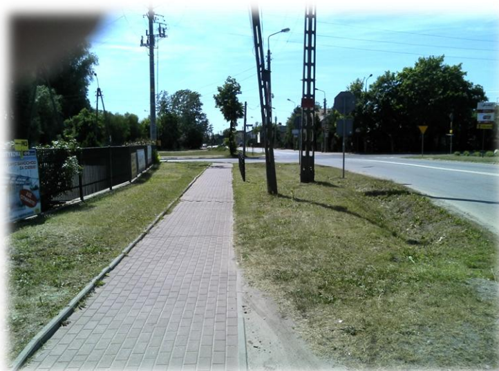
Foto.95/58 DW 579 ul. Matejki do skrzyżowania z ul. Graniczną – w kierunku zachodnim