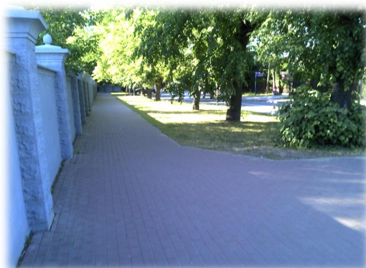
Foto.43/122 ul. Radońska po stronie zachodniej – w kierunku północnym