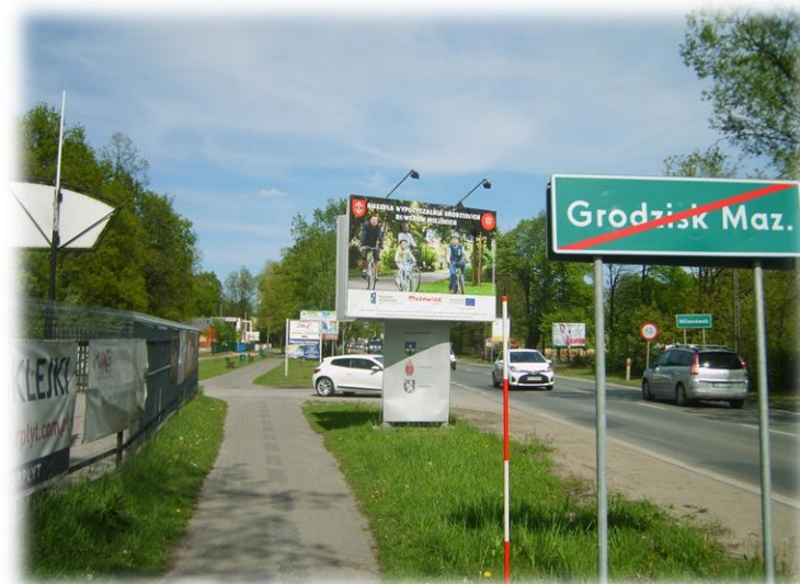
Foto.5/77 ul. Królewska (DW 719) styk z Gminą Milanówek – w kierunku wschodnim