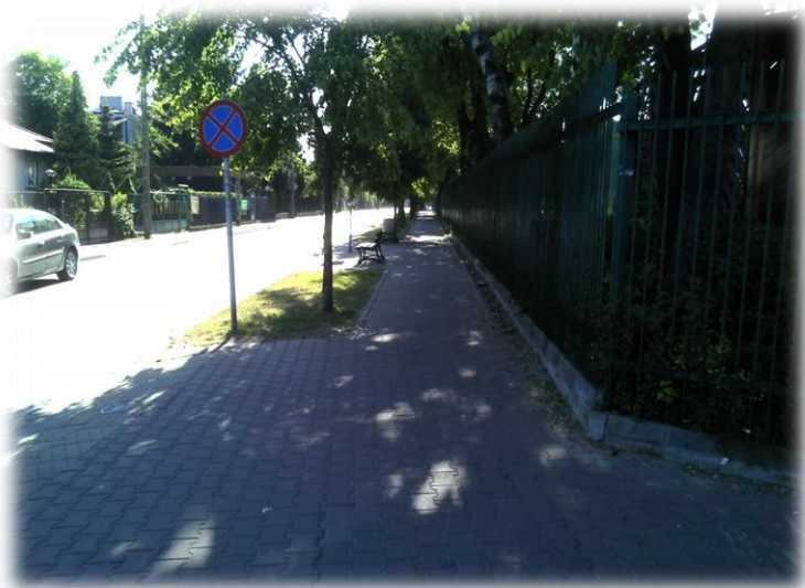
Foto.52/111 ul. Mokronoskich po stronie północnej – w kierunku zachodnim