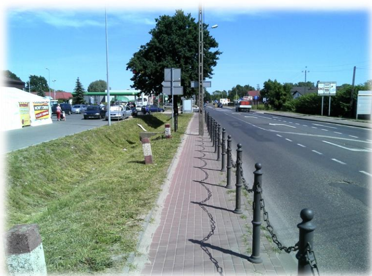
Foto.93/56 DW 579 ul. Matejki po stronie wschodniej – w kierunku południowym