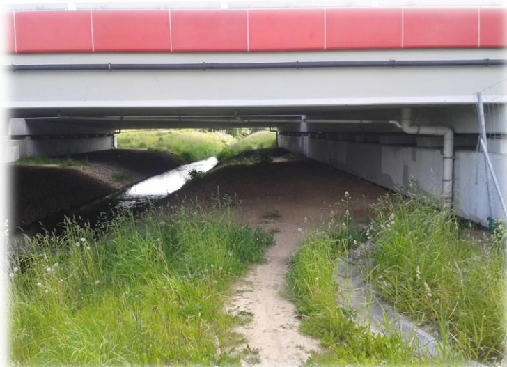
Foto.70/171 Przejście pod A2 (rzeka Rokitnica) – w kierunku południowym