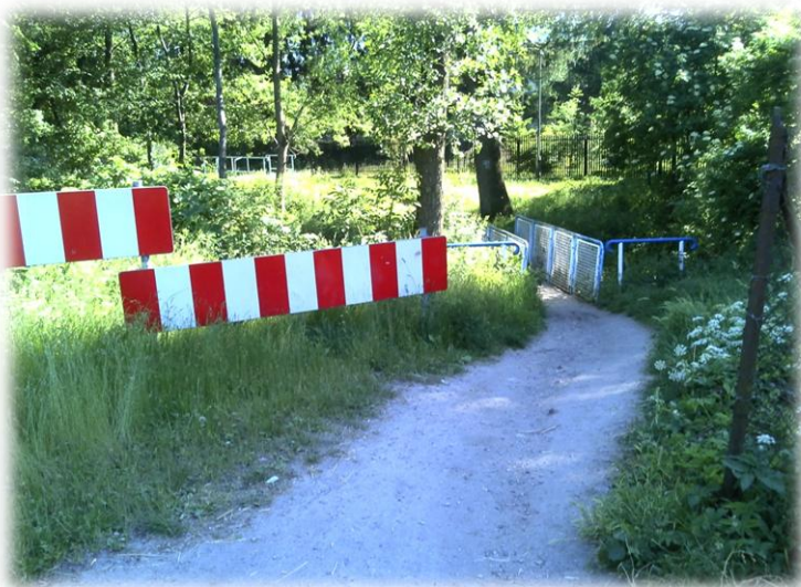
Foto.57/102 kładka nad rzeką Mrowna - w kierunku południowym od ul. Dalekiej